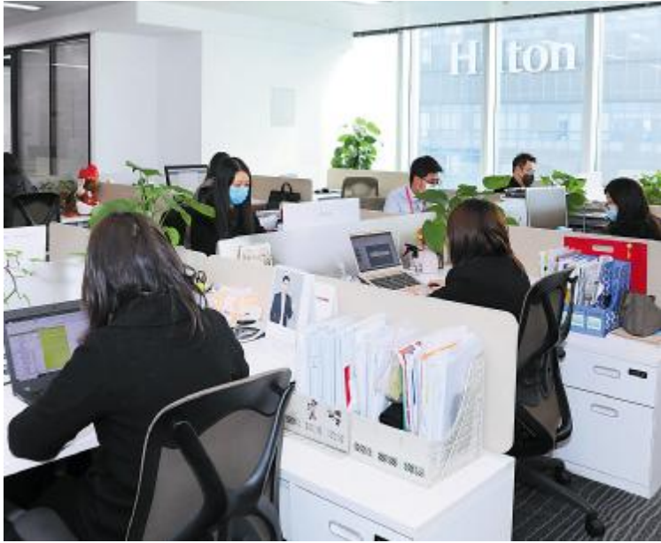
防护到位,有序复工