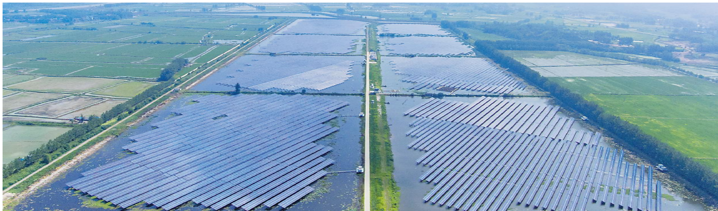
通威和县“渔光一体”基地