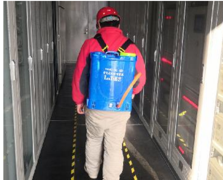
电站内部全面消杀