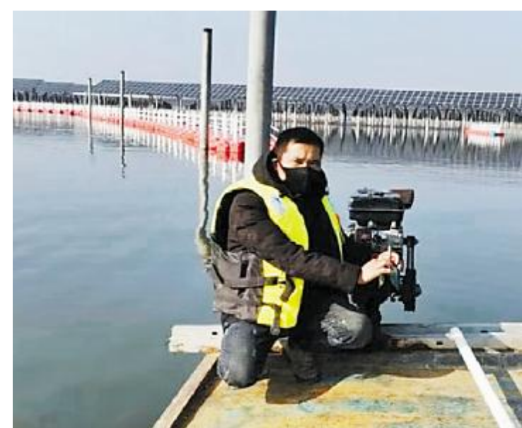
通威泗洪“渔光一体”基地巡检