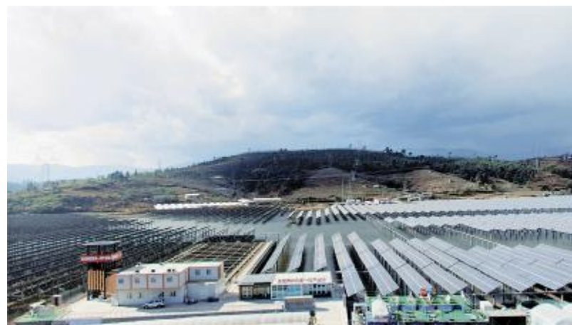
通威西昌“渔光一体”基地

2019年10月,通威扬中“渔光一体”项目积极参与国家重点研发计划项目“风电场、光伏电站生态气候效应和环境评价研究”子课题“湖泊光伏电站生态气候效应观测与机理研究”课题项目。