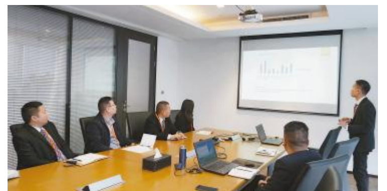
通威新能源(深圳)有限公司年终述职会