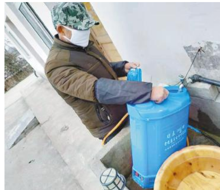
通威和县“渔光一体”基地养殖人员准备对鱼塘周围进行消毒