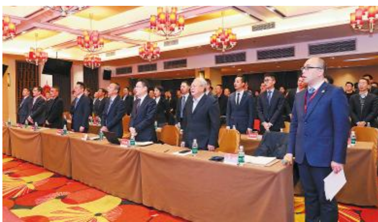
通威股份光伏事业部2019年度述职会现场

西昌、和县、扬中、龙袍、泗洪五大示范基地升级;新开发项目,“渔光一体”占比100%;2019年通威“渔光一体”设施化养殖实现全成本经营盈利。