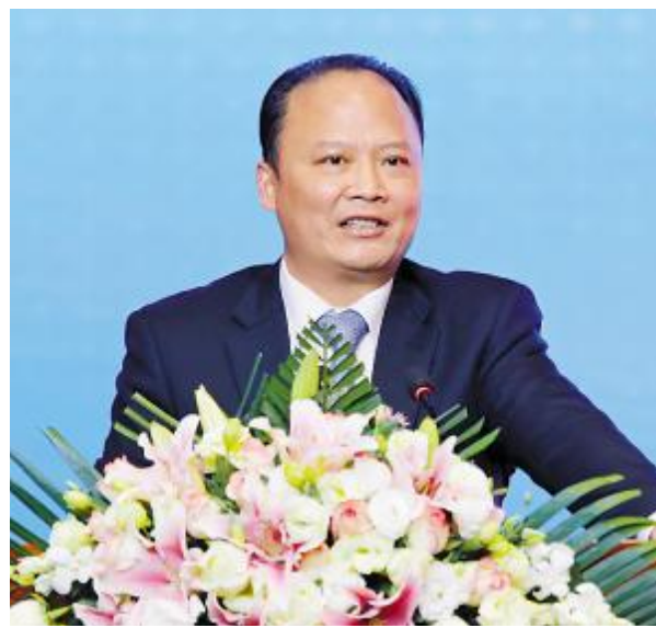
通威集团董事局刘汉元主席作重要指示