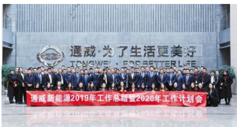
通威新能源2019年工作总结暨2020年工作计划会合影