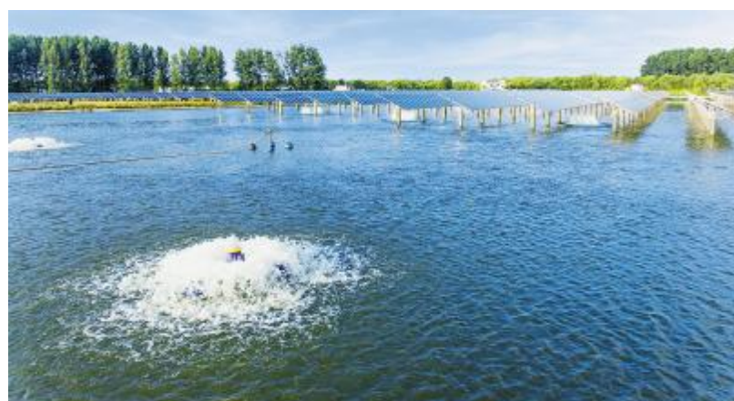
通威扬中“渔光一体”基地

园区内人员尽量减少外出,外出时必须佩戴口罩,个人医学防疫方法请参考疾病预防控制中心指导意见;对于外归来人员出现疑似症状(呼吸道症状、发热、畏寒、乏力、腹泻、结膜充血等)的人员,要及时进行监督和隔离,避免造成疾病的传播。禁止外来游客进入,关闭垂钓区域;对于强行进入的人员,劝阻无效可报警处理;渔业园区内禁止燃放烟花爆竹,以避免群众围观;禁止野生动物的捕杀和食用;重视近期禽流感传播问题,驱逐园区内野鸟,及时清理鸟粪,清理时做好自身防护工