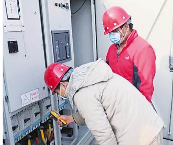
巡检设备时测试电缆接头的温度,防止过热