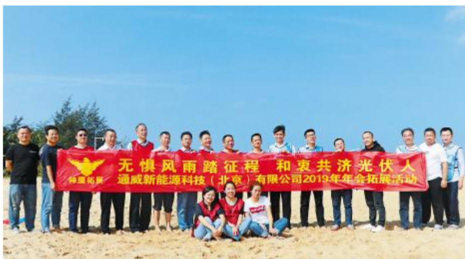
通威新能源科技(北京)有限公司年终拓展