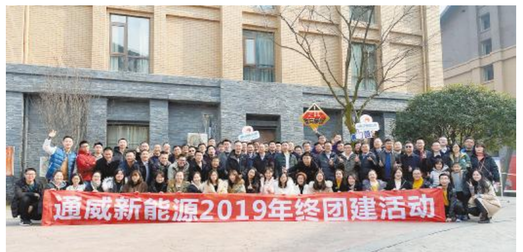
通威新能源有限公司年终团建