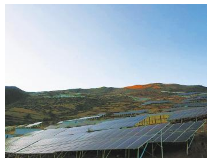
通威凉山喜德项目

长期以来,通威新能源始终将安全生产放在第一位,切实落实集团关于安全工作的相关指示精神,在通过多种安全措施的前提下,保障各电站安全稳定运行。