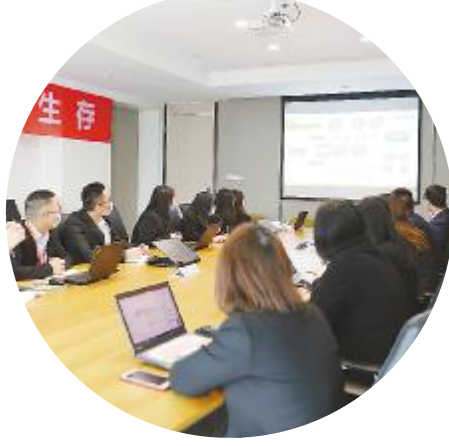
设计公司结构组培训