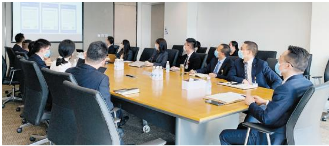
通威新能源组织集中学习刘汉元主席讲话精神