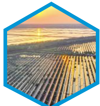
摄影大赛二等奖作品:余晖下的天门电站、茁壮成长的通威新能源