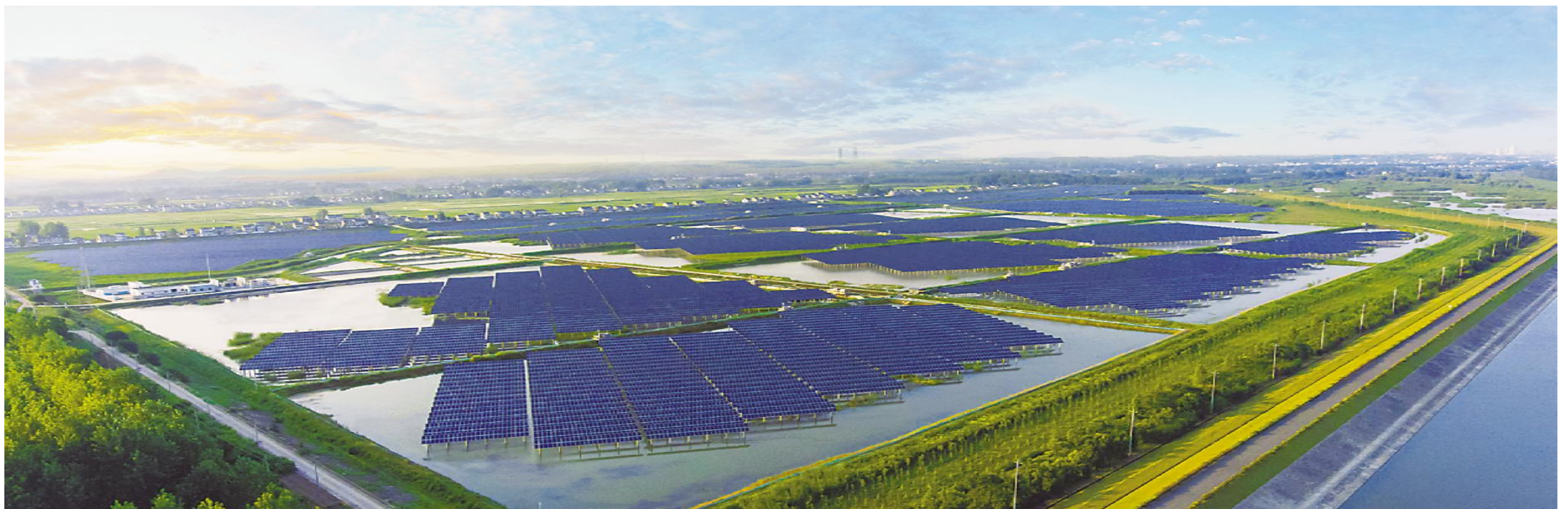
通威龙袍“蟹光一体”基地

2020年,项目组以“生态优先、绿色发展”为理念,以全面提升民众的消费意愿为目标,实现从蟹苗到饵料、从捕捞到售卖的全程可追溯,保证产品的安全性、营养价值和口味指标,着力推动渔业绿色发展,让通威“渔光一体”这一科学的养殖模式成为中国渔业转型的重要推动力量,在全国范围内加以推广和复制,从而加快推进渔业提质增效、转型升级,加强渔业高质量发展动能,不断开创渔业养殖新局面。