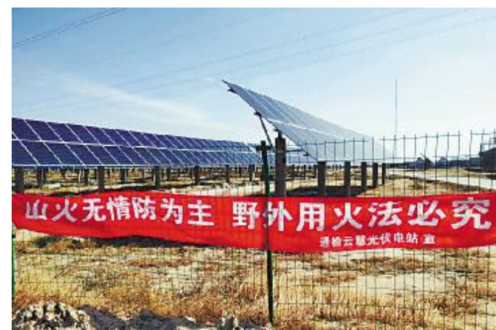
通威光伏电站悬挂防火标语