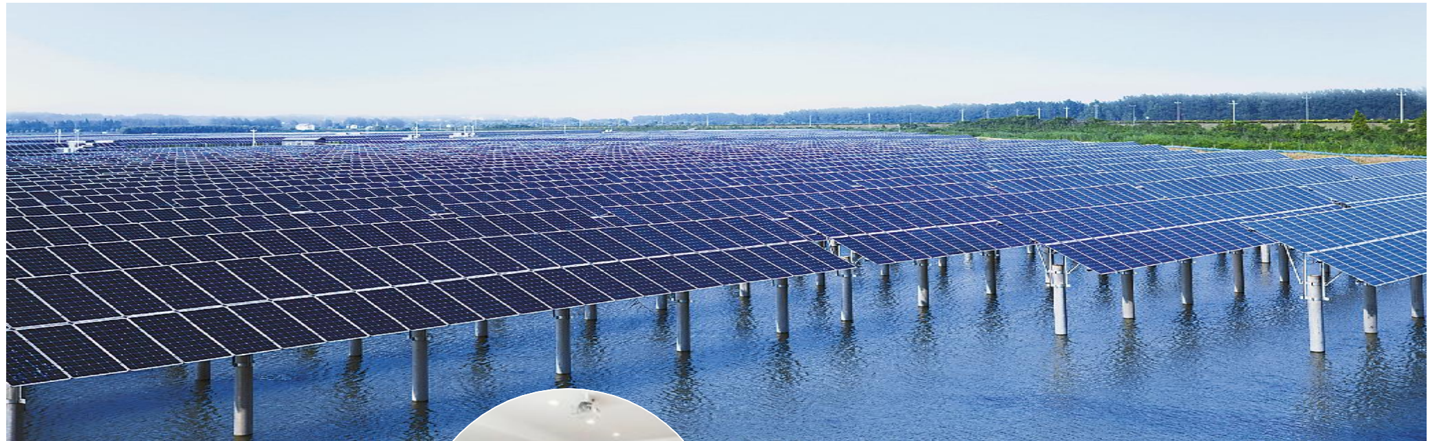
通威龙袍“渔光一体”基地