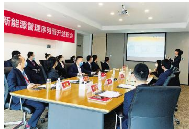
通威新能源有限公司序列晋升发展培训现场

喜德县农光牧光一体光伏扶贫电站项目位于四川省凉山彝族自治州喜德县两河口镇瓦西总村,建设规模为30MWp,项目自2018年12月成功并网,已累计发电量3397万kW.h,未来20年发电超过8亿kW.h。喜德项目通过发电收益可每年向喜德县政府提供专项扶贫款,并与当地种植专业合作开展科学农业种植和畜牧业养殖,为彝族同胞送去了先进的农业技术。