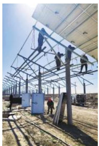
通威天津杨家泊项目建设现场

● 通威新能源各电站认真贯彻公司春季防火要求,打好人防技防“组合拳”,确保电站各项工作安全运行。