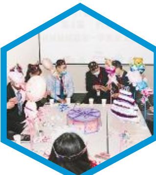
通威新能源一季度生日会现场

通过此次刘主席重要讲话专题学习,使公司全员更加深刻地了解通威文化,更加深刻地了解刘主席的管理哲学及通威的经营之道。在今后的工作中,各公司、各部门会将刘主席指导思想融会贯通到日常工作中,充分发挥员工潜能,养成良好的工作作风,指导和督促各项工作的快速推动,提高各环节工作效率,强化执行力打造,有效提升终端的市场占有率及行业竞争水平。