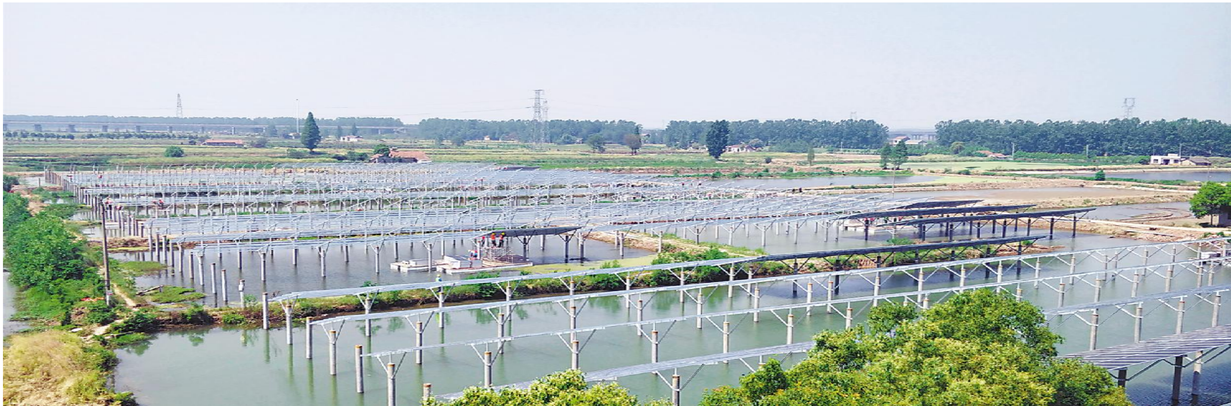
通威湖北公安项目建设现场